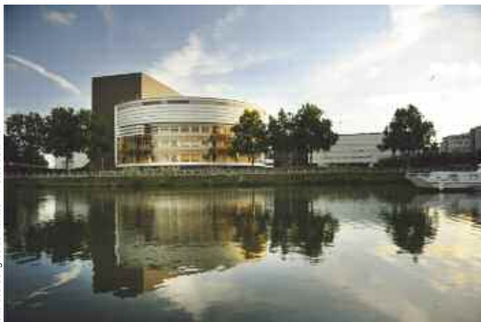
Cité des Congrès de Nantes

Sur ce qui doit être recherché pour évaluer les besoins de l'enfant et selon quels critères en fonction des contextes.